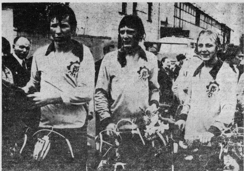
Участники велопробега 1976 г.

они через Семипалатинск, Павлодар, Кокчетав, Челябинск, Уфу, Куйбышев, Саратов. Встретить их прибыли более тридцати ветеранов бригады. Местом сбора был выбран моторный завод.