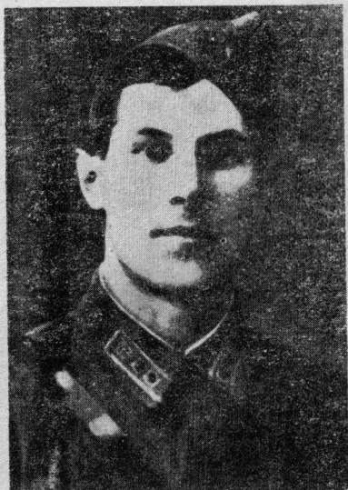
Ф. С. Жуков.