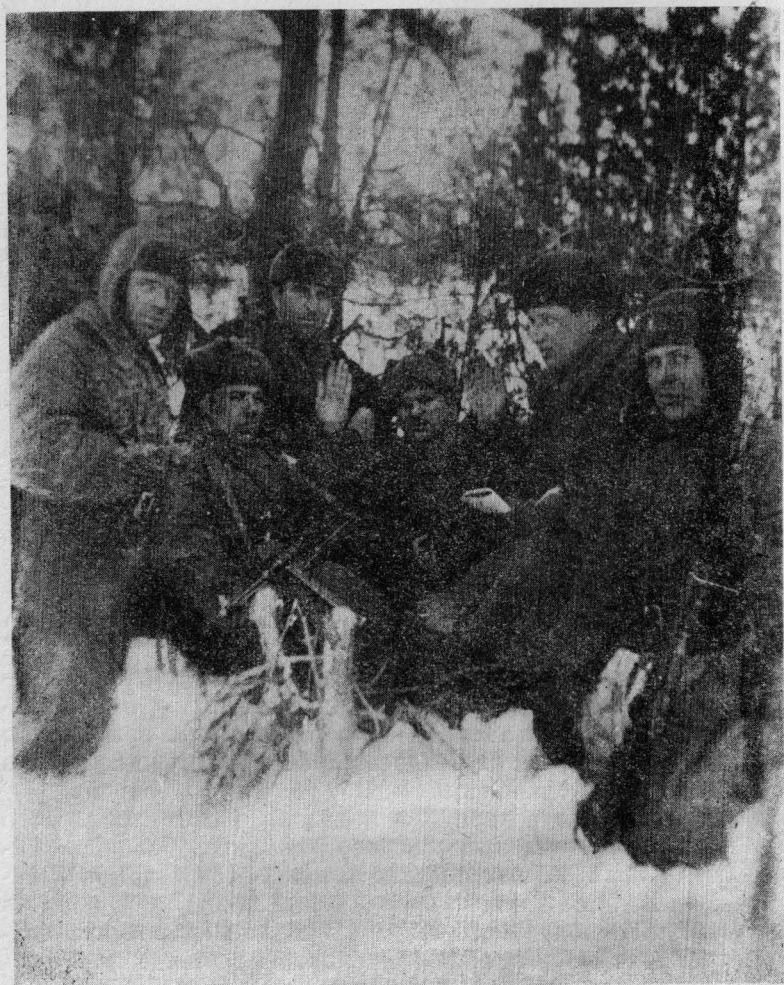
Заседание парткомиссии по приему в партию.